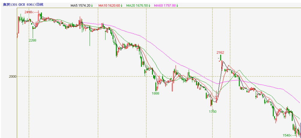
焦炭期货走势图（J1301 合约日 K 线图）