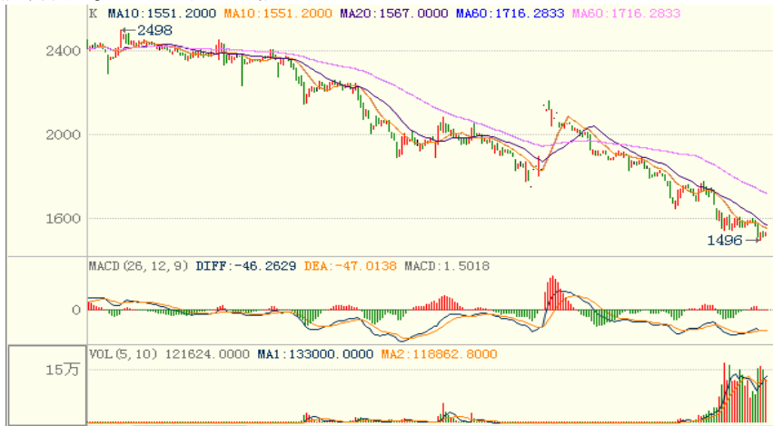
焦炭期货走势图 (J1301 合约日 K 线图)