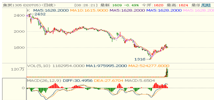
焦炭期货走势图（J1305 合约日 K 线图）