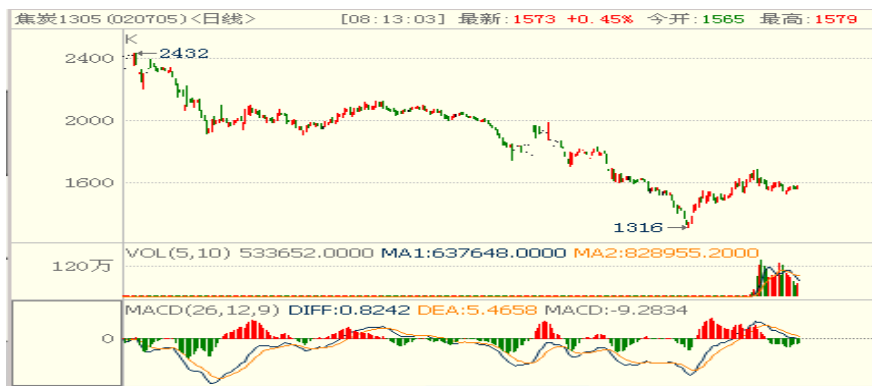
焦炭期货走势图（J1305 合约日 K 线图）