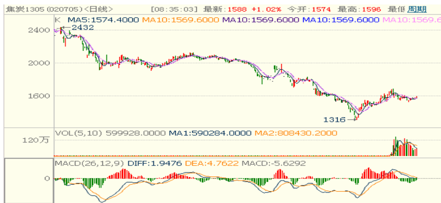
焦炭期货走势图 (J1305 合约日 K 线图)