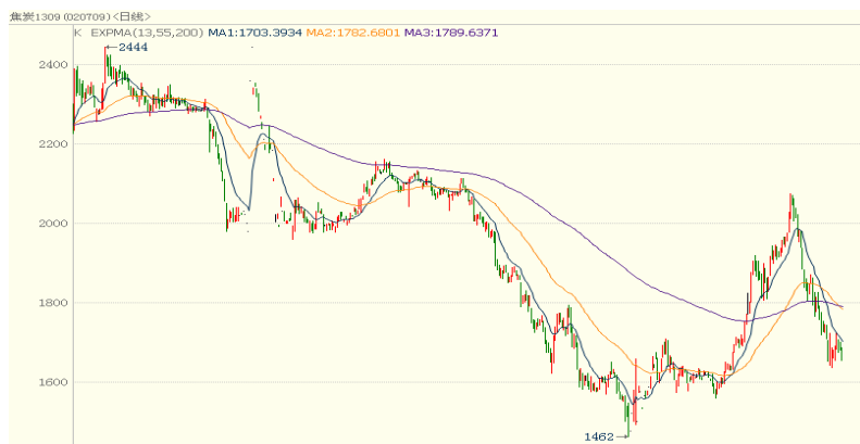
焦炭期货走势图（J1309 合约日 K 线图）