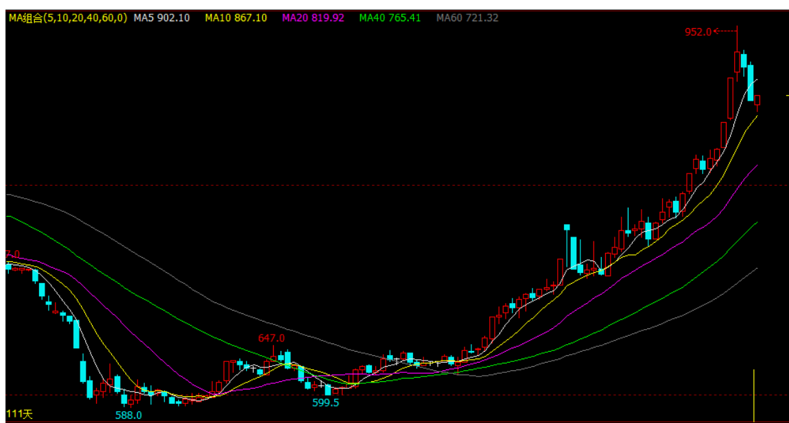
焦炭期货走势图 (J1609 合约日 K 线图)