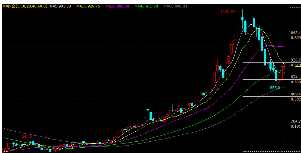
焦炭期货走势图 (J1609 合约日 K 线图)