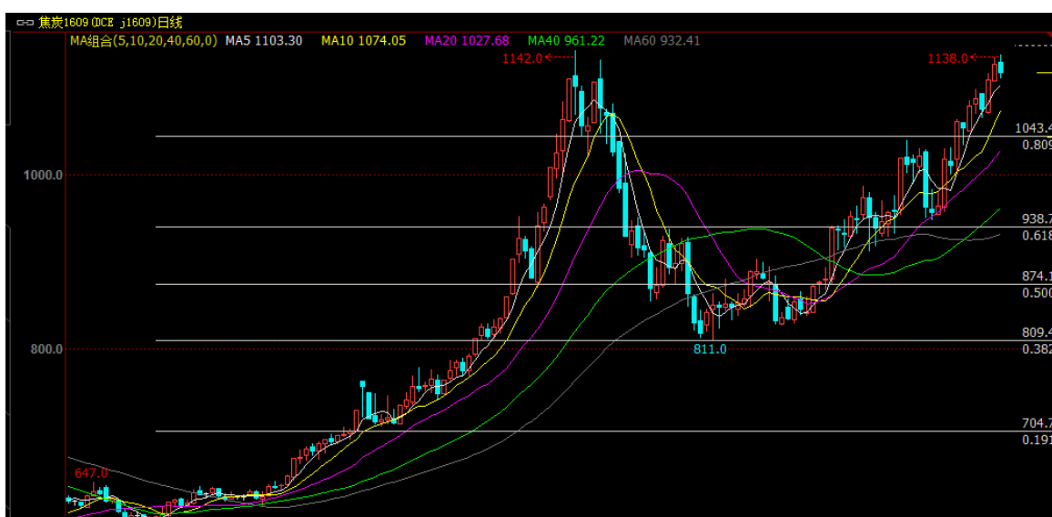
焦炭期货走势图 (J1609 合约日K线图)