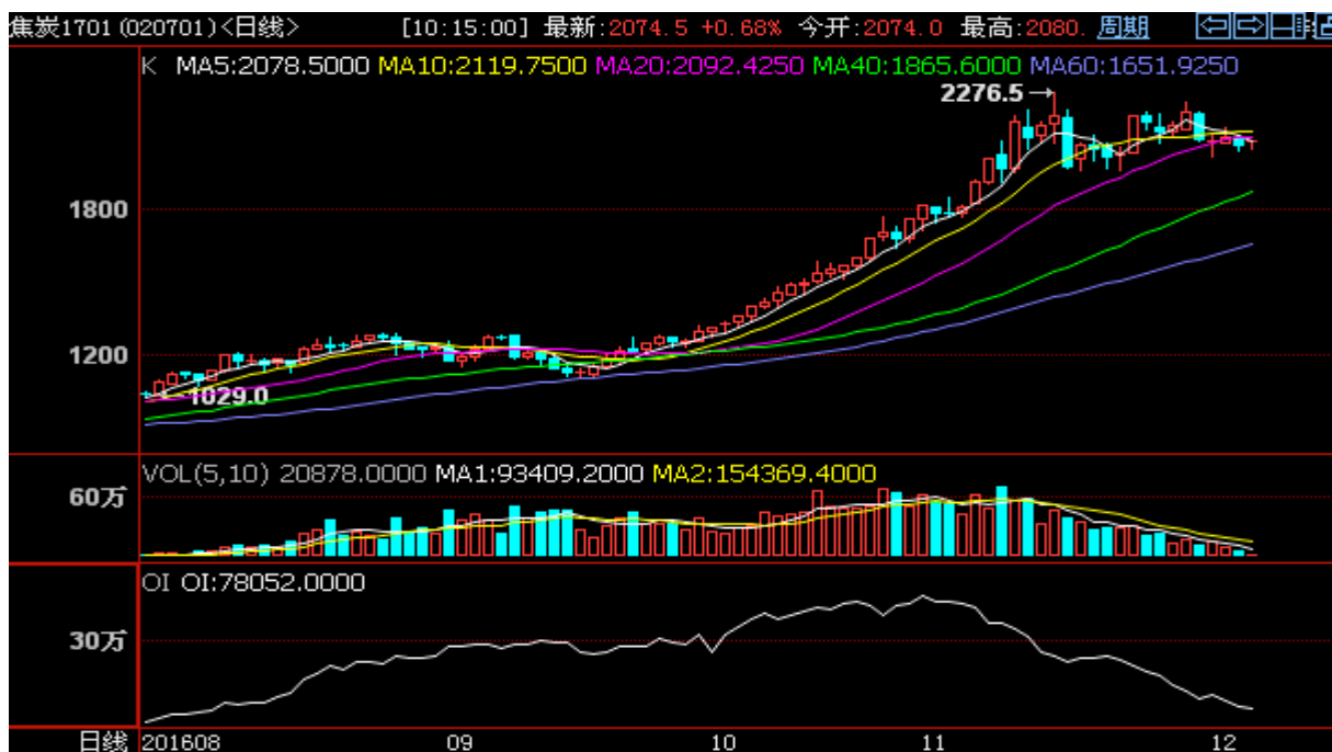
焦炭期货走势图 (J1701 合约日 K 线图)