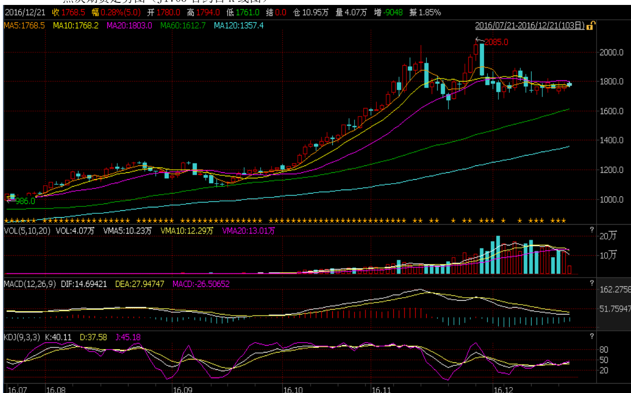
焦炭期货走势图 (J1705 合约日K线图)