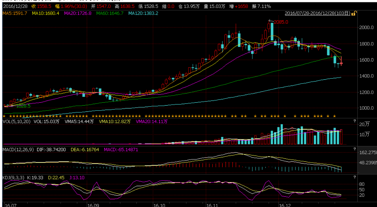
焦炭期货走势图（J1705 合约日K线图）